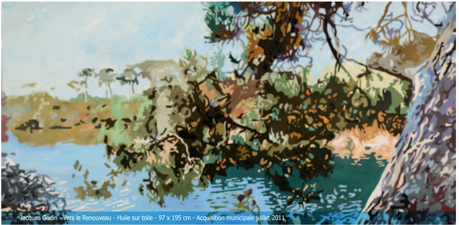
Jacques Godin - Vers le Renouveau - Huile sur toile - 97 x 195 cm - Acquisition municipale juillet 2011