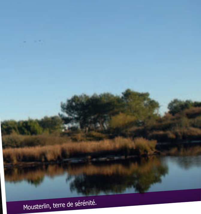
Mousterlin, terre de sérénité.