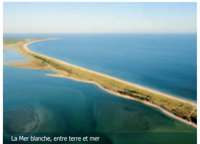
La Mer blanche, entre terre et mer