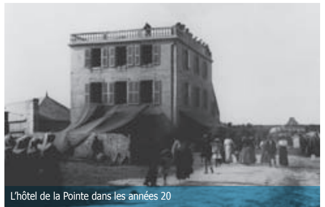
L'hôtel de la Pointe dans les années 20