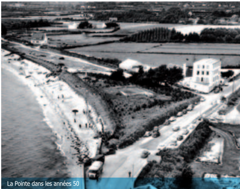
La Pointe dans les années 50