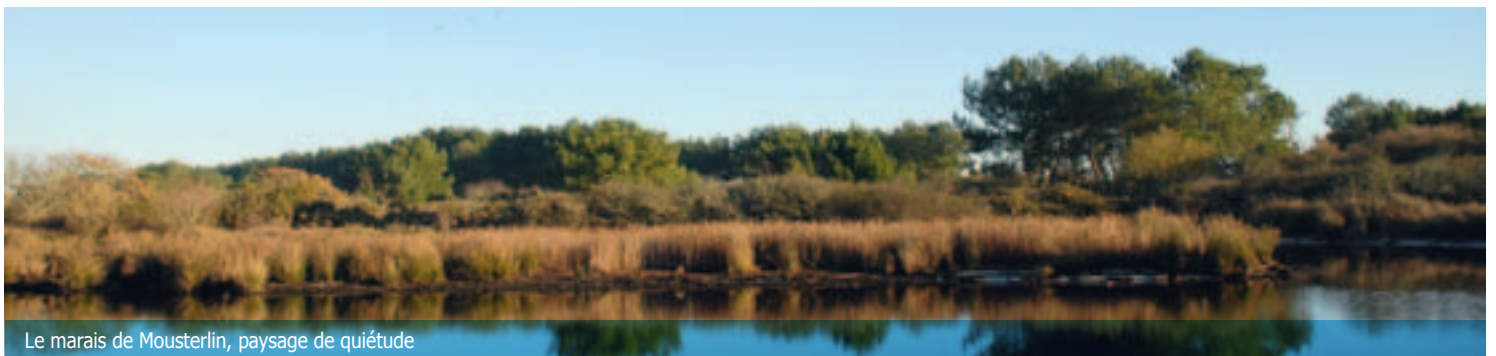
Le marais de Moustierlin, paysage de quiétude

Retrouvez votre prochain cahier spécial en mai