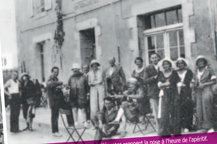
Après la première guerre mondiale, les élégantes prennent la pose à l'heure de l'apéritif.