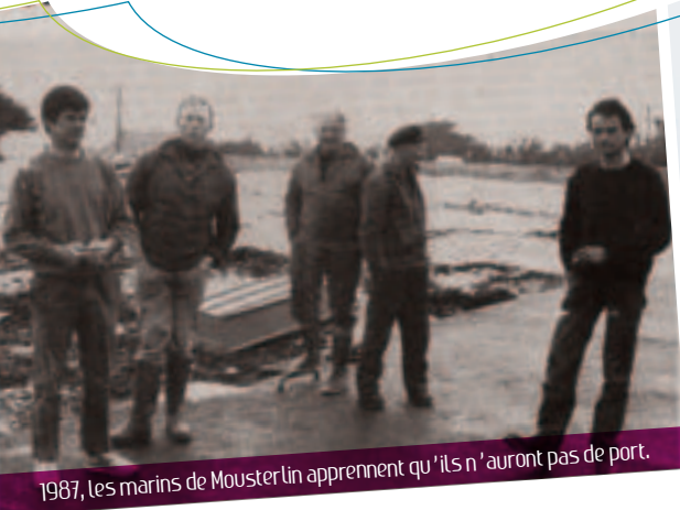
1987, les marins de Moustierlin apprennent qu'ils n'auront pas de port.

La réalisation d'un lotissement en 1971 annonce l'urbanisation de Moustierlin