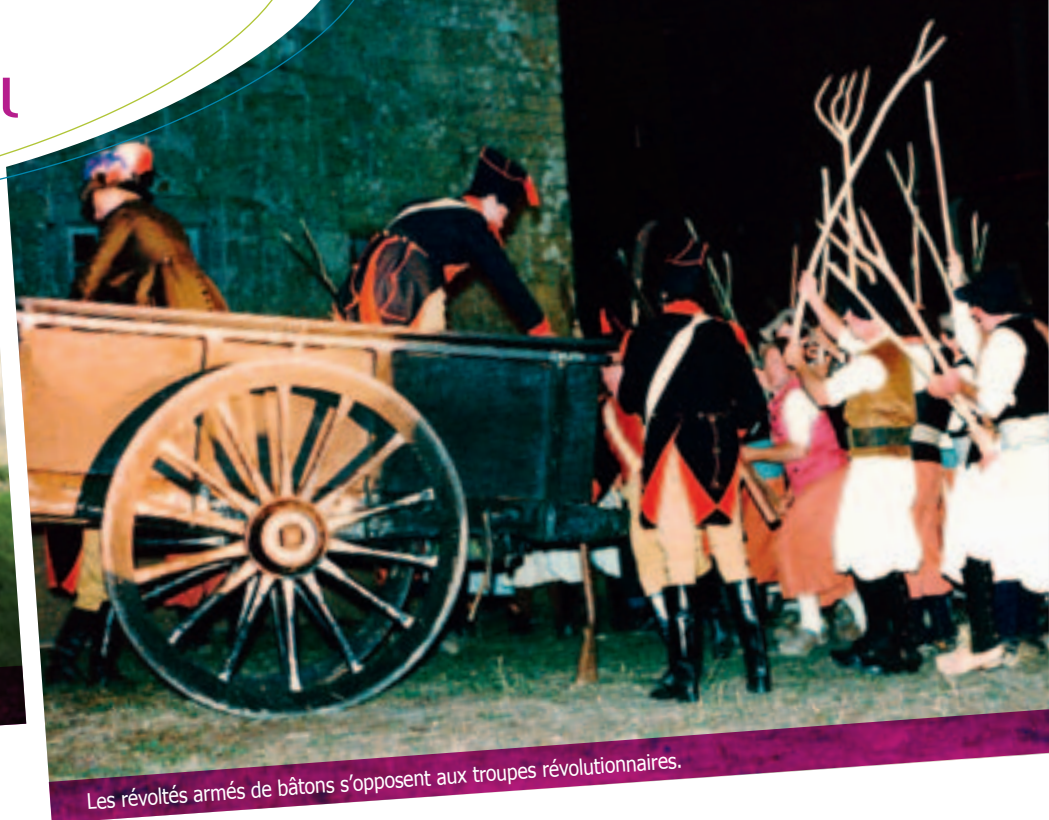
Les révoltés armés de bâtons s'opposent aux troupes révolutionnaires.