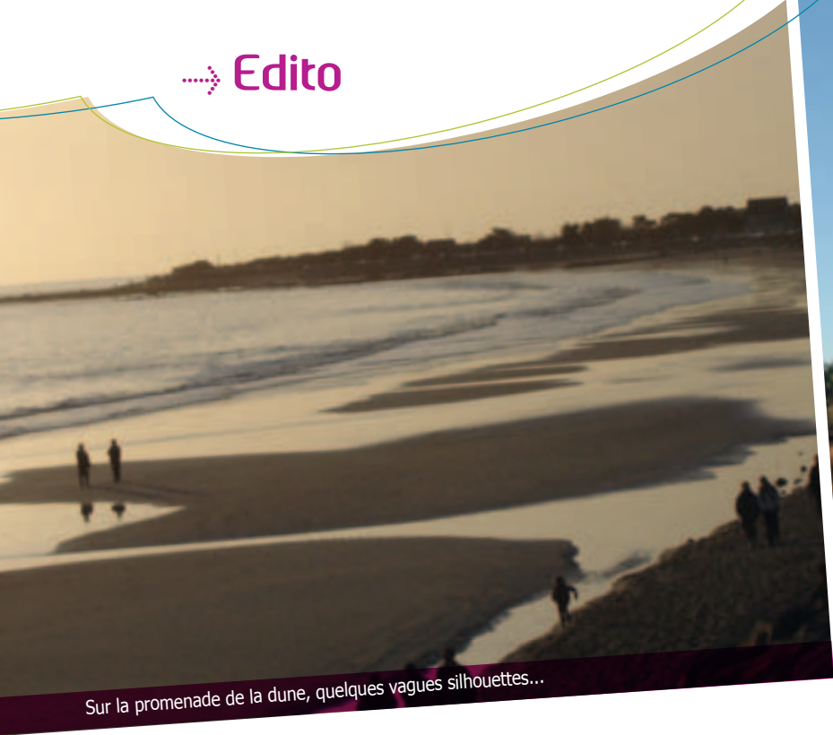
Sur la promenade de la dune, quelques vagues silhouettes...