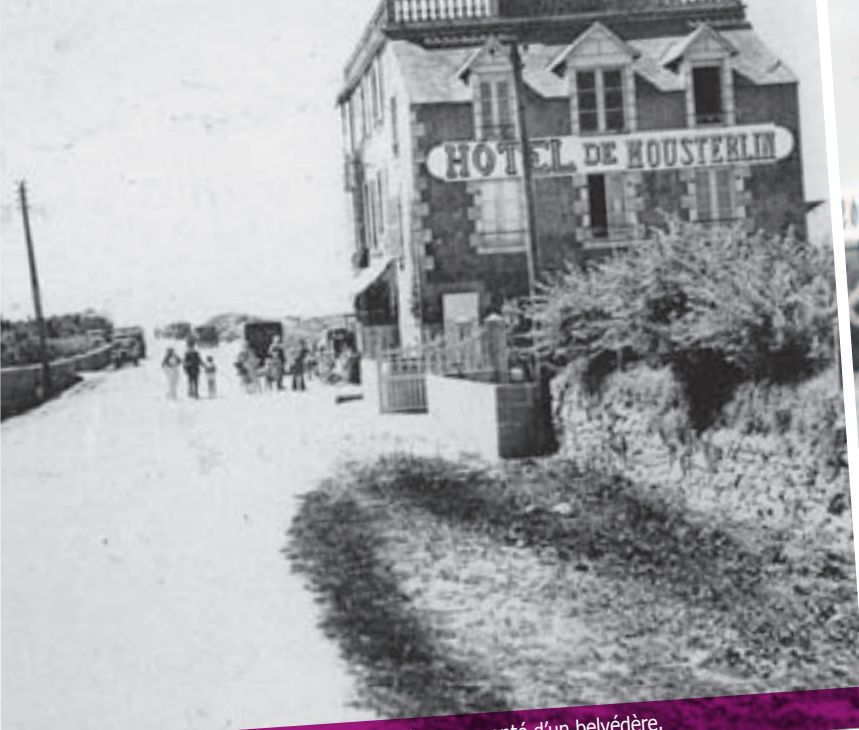
Dans les années 20, l'hôtel de deux étages était surmonté d'un belvédère.